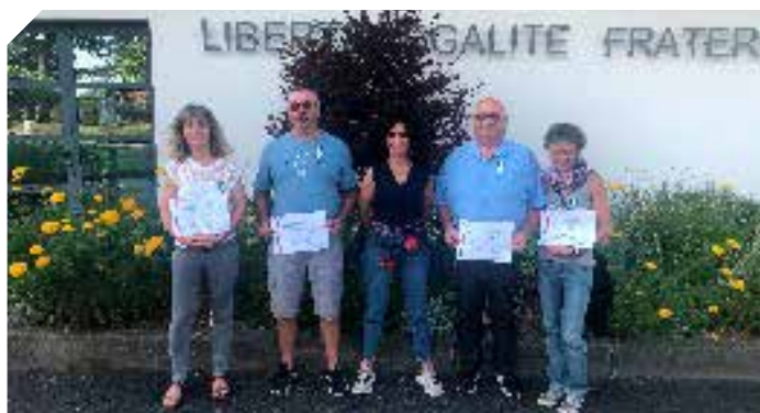
Remise des Médailles d'Honneur Régionale Départementale et Communale en Argent par M.le Maire : 24 juin 2022