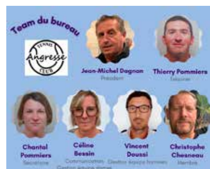
Le bureau du TCA

Retrouvez l'ensemble des associations sur le site internet angresse.fr