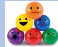
Tableau des émotions :

Expression corporelle, Des balades, de la cuisine, du RIRE, des JEUX, du REPOS et bien d'autres activités Attendront vos enfants pour ces vacances.